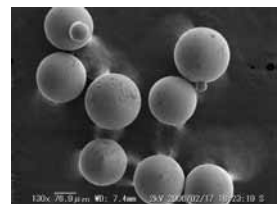
メディブライト用メディア

メディアは非常に細かい粒ですが、砂や研磨剤などと違い、一個一個の表面が滑らかな球形です。だからパーツ類の表面を傷つけることなく、従来のウェットブラストよりも美しい輝きを魅らせることができるのです。メディアがこれまでにない輝きをもたらすので、名前にもこだわってみました。「メディア」+「ブライト（輝き）」、だから「メディブライト」というわけです。