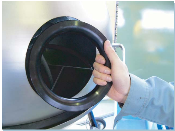
■キャビネットにリングをはめこみます。